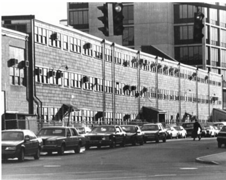
El Edificio 20, hoy ya demolido, con el Edificio 26 detrás

no era extraño encontrarlos a altas horas de la madrugada recorriendo edificios y túneles de servicio intentando averiguar cómo funcionaba el complejo sistema telefónico del MIT, sistema que llegaron a conocer mejor que quienes lo habían instalado, o abriendo puertas tras las que oían algún sonido intrigante para ver qué era lo que lo producía, y si no había nadie que lo impidiera, ponerse a tocar la máquina en cuestión intentando ver qué hacía y cómo funcionaba.